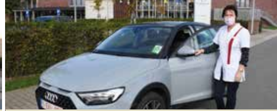
Helden van de zorg (p.3)