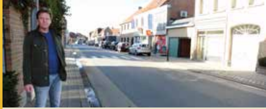
Snelheidsverlaging in de Boezingestraat (p.2)