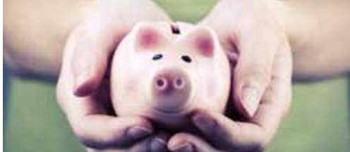
Blijft u ook betalen? p. 2