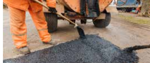
Onze straten verdienen beter p. 3